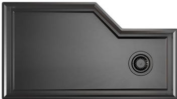
Fregadero Diade Gun Metal 3028 006